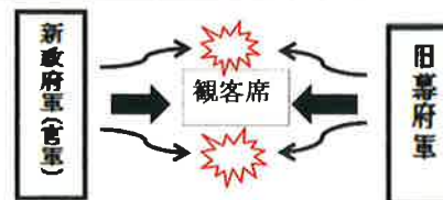
五稜郭祭・実演のイメージ図 (観客席に臨場感を体感してもらう)