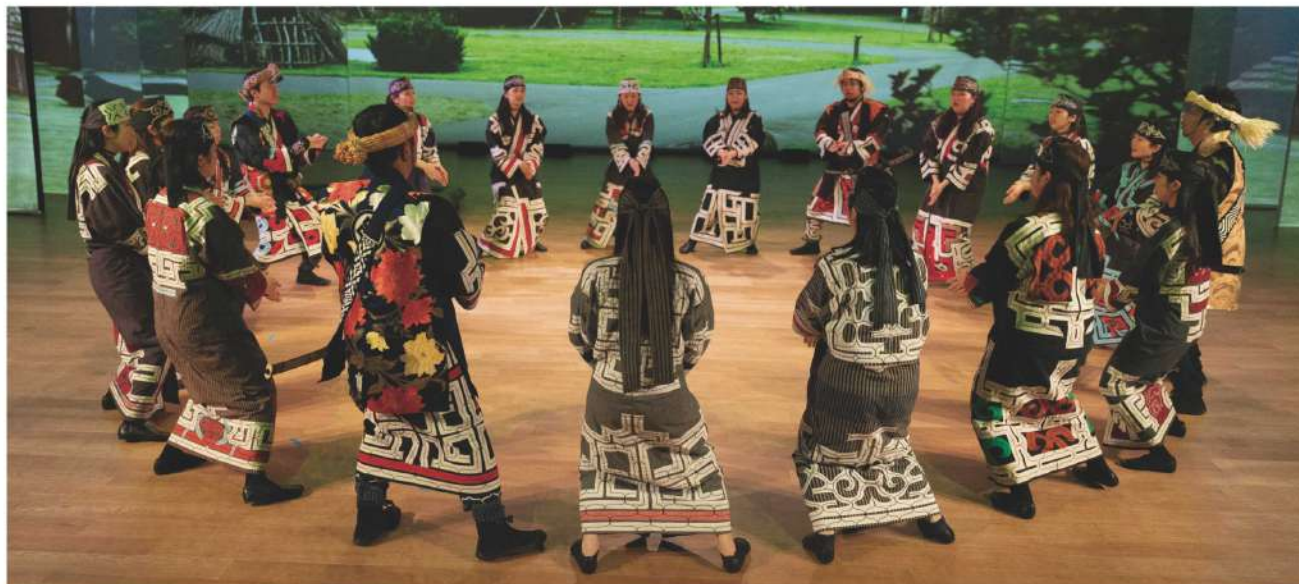
体験交流ホールで披露される古式舞踊