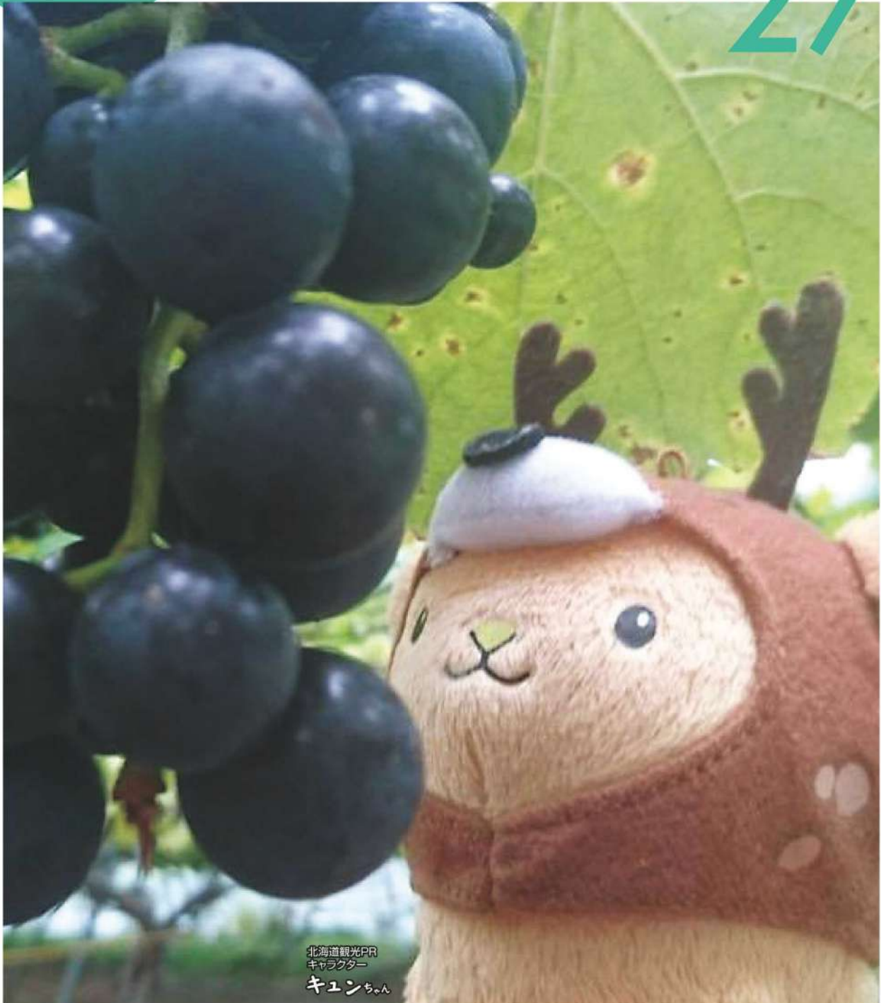
北海道観光PR キャラクター キュンちゃん