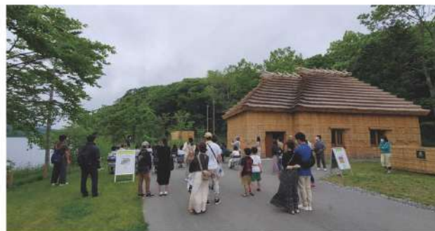
伝統的コタンで行われる体験プログラム