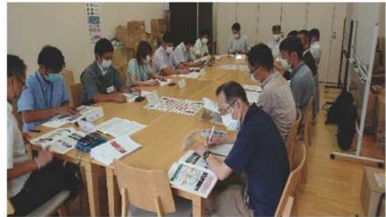
上川きた地域事業説明会「スポーツアクティビティを核とした旅行商品造成事業」