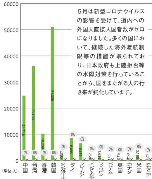
道内空港における外国人入国者数(主な国別) ■ H31年5月 ■ R2年5月