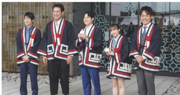
開業初日は鈴木知事やアンバサダーらが来場者をお出迎え

今年度は約700校6万7千人の受け入れ(8月末時点)を見込んでおり、令和3年度の教育旅行受け付けについては12月頃に開始される予定です。(公益財団法人アイヌ民族文化財団)