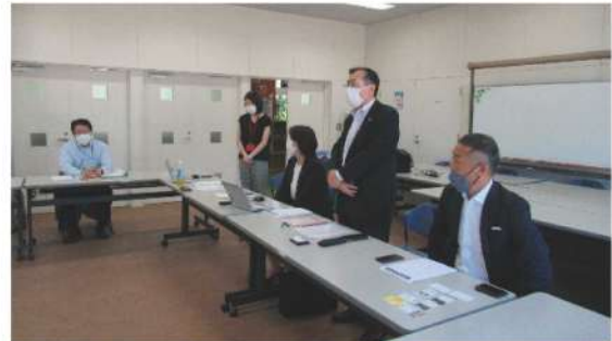
空知地域事業説明会「空知地域の観光資源を活用したインバウンド誘致推進事業」

当機構では、訪日外国人旅行者の周遊促進を図るため観光庁の「訪日外国人旅行者周遊促進事業費」を活用して、道東・道北・道央地域の空港をゲートウェイとして、各地域の状況に応じたコンテンツの開発や磨き上げ等の取り組みを実施しています。今年度は道内8地域で予定しており、8月から順次下記の6地域で地域の方々を中心となって「新たな地域の魅力を創出するインバウンド推進開発事業」を開始いたしました。