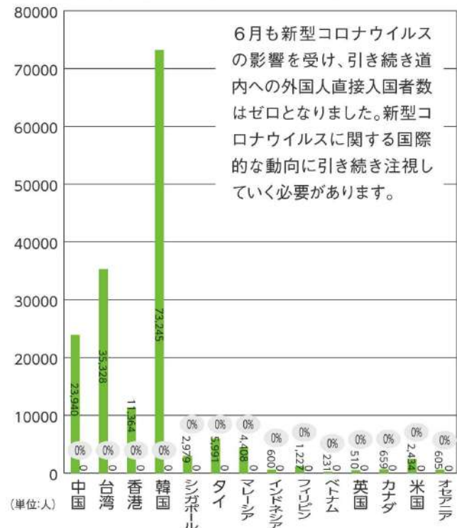
道内空港における外国人入国者数(主な国別) ■ H31年6月 ■ R2年6月