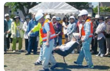
▲ 椅子を使った障害者搬送