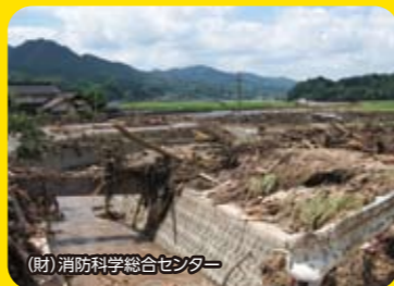
(財)消防科学総合センター

風水害とは、強風・大雨・高潮・波浪などによって起こる災害の総称です。道内でも集中豪雨による土砂災害や家屋浸水といった災害のほか、雷や竜巻も発生しています。いざというときに適切な行動がとれるように、日頃から風水害に対する備えについて考えましょう。