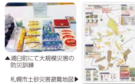
▲ 浦臼町にて大規模災害の防災訓練

要準備 ▶ 配付用の避難マップ ▶ お客様が滞在する場合を想定した備蓄物資の確保