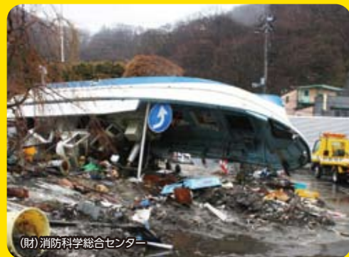
(財)消防科学総合センター

まわりを海に囲まれた北海道では、巨大地震に続いて津波が襲ってくるケースが多いのが特徴です。1952年の十勝沖地震(M8.2)や1993年の北海道南西沖地震(M7.8)などをはじめ、北海道に大きな被害をもたらした地震は多くが海域で発生し、地震とともに津波による被害が拡大しました。また、2011年の東北地方太平洋沖地震や1960年のチリ地震津波のように、周辺や外国で発生した地震による津波の被害を受けることもあります。屋外や室内の耐震化など地震への備えはもちろん、海に近い地域では津波を想定した防災計画を立案するようにしましょう。