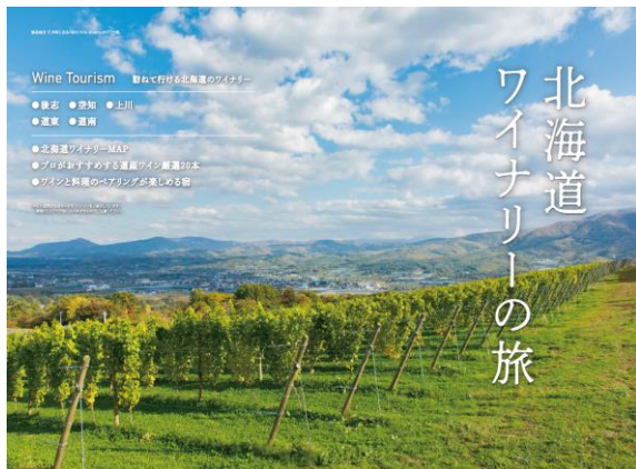
北海道生活 別冊 「北海道大人の旅ガイド」