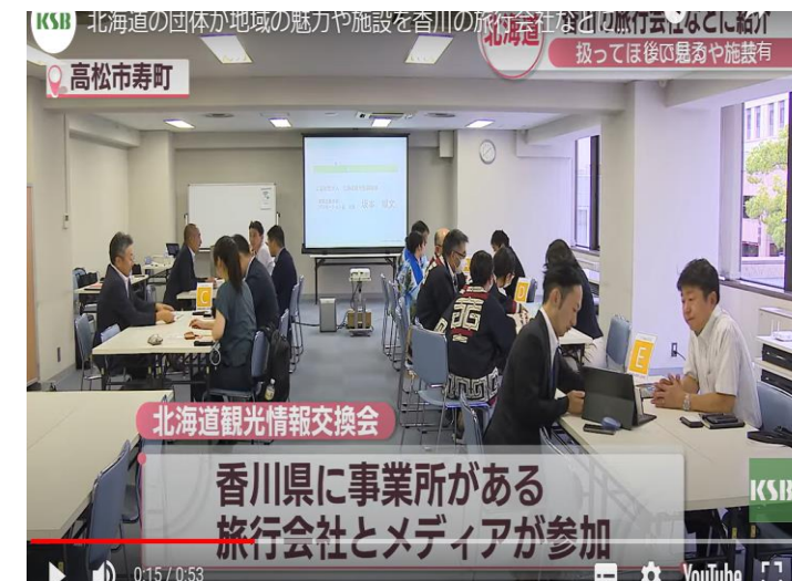
香川での情報交換会の様子