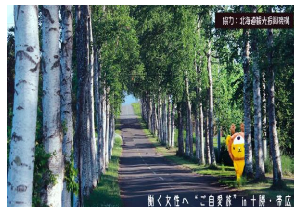
日経BPアドパートナーズ 「ご自愛旅IN十勝・帯広」