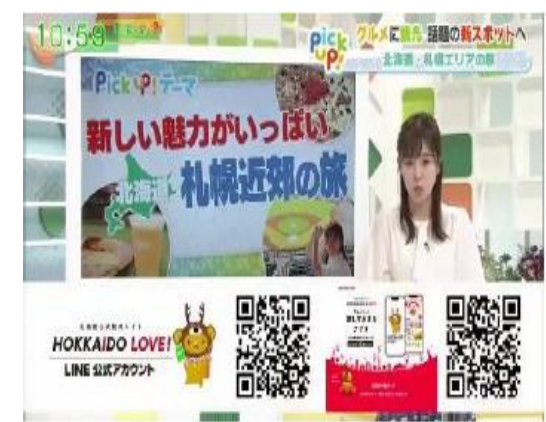
新潟テレビ21 まるどりっ！UP