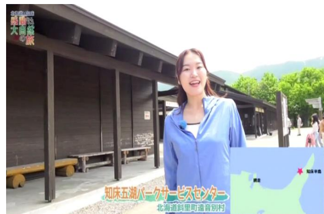
三重テレビ 「北海道知床 感動あふれる大自然の旅」