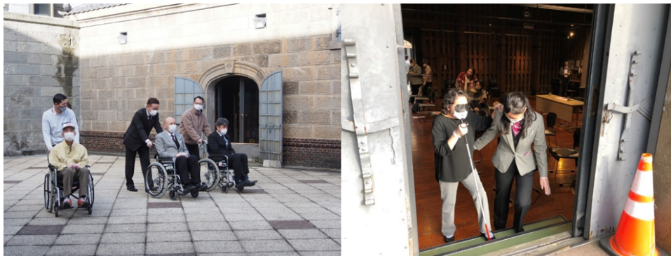
左・中央：小樽での観光介助士講座の様子

また、北海道では「心のバリアフリー」の普及・促進を目指しており、観光庁「観光施設における心のバリアフリー認定制度」に対応した形で研修を実施し、認定マークの取得をサポートします。