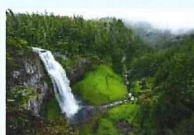
Green Travelers (自然・エコ)