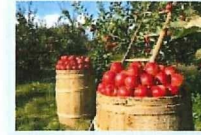
WOOFing Farming (農業体験)