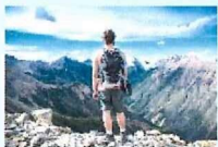
Adventure Travelers (アドベンチャー)