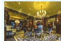
Luxury Travelers (豪華旅行)