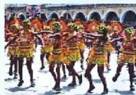
Local Culture (地域文化)