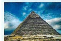
History Buffs (歴史)