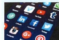
Trend setters (トレンド)