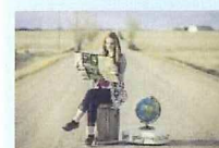
Female Travelers (女子旅)