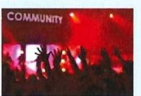
Nightlife Lovers (ナイトタイム)