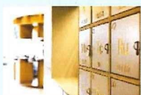
Budget Travelers (低予算旅行)