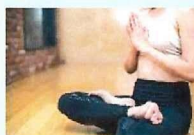
Relaxation (リラクゼーション)