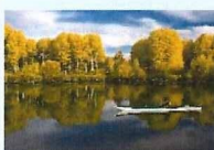
Outdoor Enthusiasts (アウトドア)