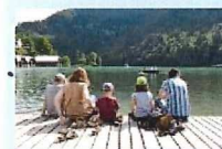
Family Travelers (家族旅行)