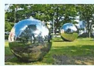
Art&Design Lovers (芸術)