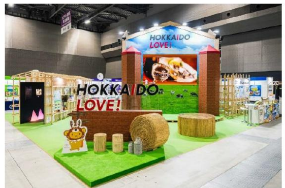
公益社団法人北海道観光機構/ 北海道旅客鉄道株式会社/北海道エアポート株式会社